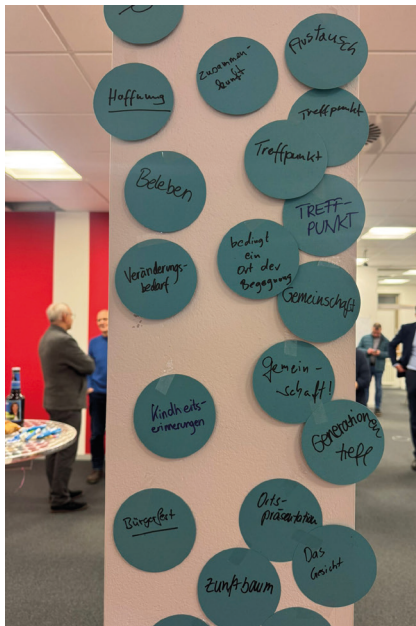
Bei einem offenen Mitmach-Workshop in der ehemaligen Laaberer Sparkasse wurden Ideen zum Marktplatz gesammelt.