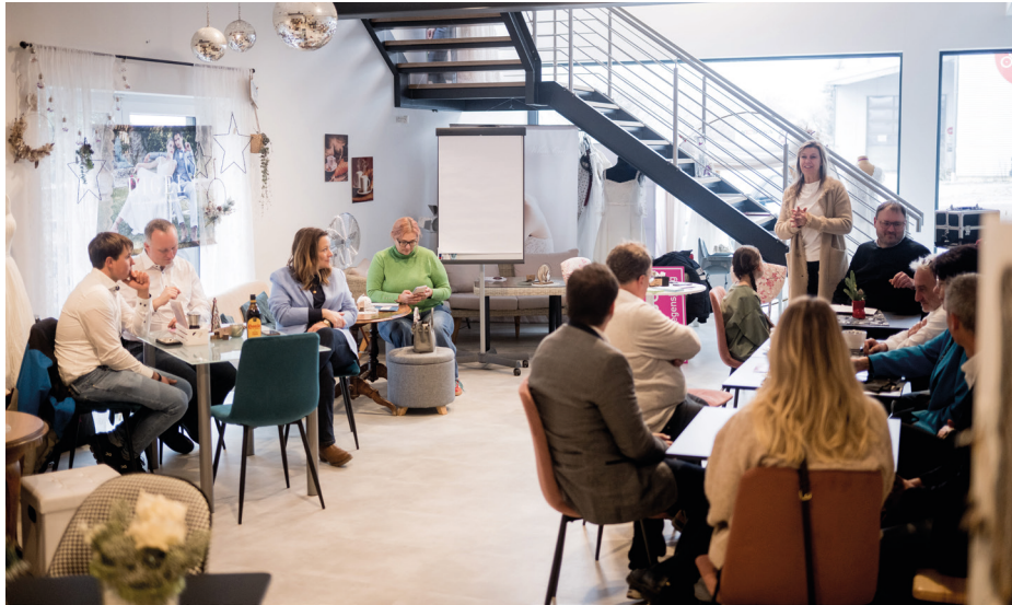
Bei einer Klausurtagung beschäftigten sich die Marktratskandidatinnen und -Kandidaten der CSU intensiv mit den verschiedenen Themen im gesamten Marktgebiet.